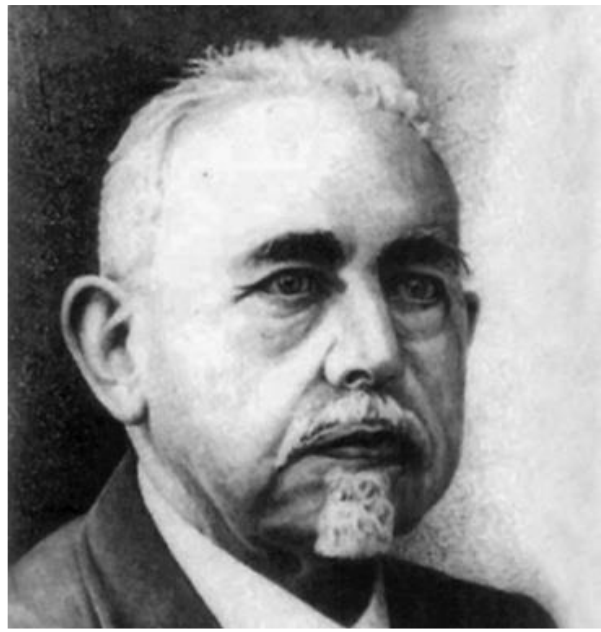
dr. Oepke Noordmans opponent want de preekstoel centraal

In de jaren '20 en '30 is er een hele discussie over kerkbouw en -inrichting. Daar wordt bepaald dat met instemming van de Liturgische kring en de Vereniging Kerkopbouw de volgende eisen dienden te worden gesteld: